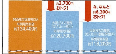
年間の電気料金比較

※お客さまの電気の使用パターン、使用量によってはお得にならない場合がございます。 ※電気料金の割引であり、ガス料金の割引ではございません。