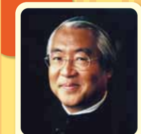
[全国大会審査委員長] 服部幸應 はっとりゆきお / (学) 服部学園理事長、服部米養専門学校校長、医学博士、内閣府「食育推進会議」委員、「早稲早稲朝ごはん」全国協議会副会長、食育を通じて生活習慣病予防や地球環境保護の講演活動に積極的に取り組んでいる。藍綬褒章、厚生大臣表彰および、フランス政府より国家功労勲章および農功勲章を受章。